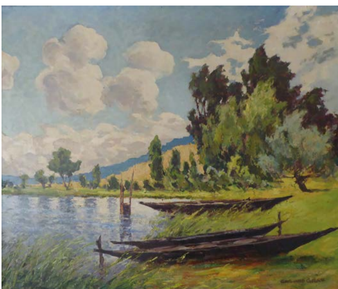
Gerhard Graf, Sandberg in Phöben, Glindower Alpen , Öl auf Leinwand, nach 1927

Ende des 19. Jahrhunderts entwickelte sich die ländliche Region rund um den Schwielowsee zu einem beliebten Ausflugsziel. Auch Künstlerinnen und Künstler machten sich auf den Weg. Durch die Erschließung des Umlandes von Berlin und Potsdam durch Eisenbahn und Schifffahrt wurden die Seen, der Flusslauf der Havel sowie die Wälder und Wiesen der märkischen Landschaft zunehmend als bildwürdige Themen entdeckt. Anders als in anderen Künstlerkolonien gab es in Ferch und rund um den Schwielowsee keinen festen Zusammenschluss von Malern. Sie kamen allein oder in kleinen Gruppen. 1928 wurde Ferch in einem Artikel der Potsdamer Jahresschau als ein märkisches Malerdorf bezeichnet. Tatsächlich erhielt Ferch seine Anerkennung als Künstlerort durch die beiden Maler Karl Hagemeister (1848–1933, 1898 Gründungsmitglied der Berliner Secession) und Carl Schuch (1846–1903).