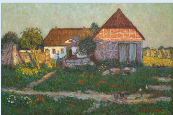
Arthur Borghard, Bauerngehöft am Kornfeld , ca. 1910, Öl auf Leinwand; © Museum der Havelländischen Malerkolonie Foto: Kerstin Weßlau

Auch Theo von Brockhusen (1882–1919) ließ sich im Havelland zur Landschaftsmalerei anregen. Von 1906 bis 1918 kam er regelmäßig nach Baumgartenbrück, wo er immer wieder in seinen Panoramabildern die Stahlbogenbrücke darstellte, welche die alte Holzbrücke ersetzt hatte, um dem wachsenden Ausflugsverkehr standzuhalten.