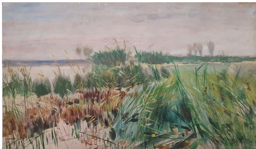
Karl Hagemeister, See mit Schilfufer (Aufgehende Sonne am Schwielowsee) , o. D., signiert, Pastell © Dauerleihgabe im Museum der Havelländischen Malerkolonie

2002 gründete sich der Förderverein Havelländische Malerkolonie e. V., um das künstlerische Wirken dieses Gebietes zu bewahren und die einzelnen Verbindungen der Künstler untereinander, ihre Freundschaften und Bekanntschaften zu erforschen. Das Museum in einem reetgedeckten Fachwerkhaus aus dem 18. Jahrhundert, das ortsbildprägend für das einstige Fischerdorf erhalten geblieben ist, konnte 2008 eröffnet werden. Die Havelländische Malerkolonie ist, ebenso wie die Künstlerkolonie Heikendorf, als Mitglied von euroart in ein Netzwerk eingebunden, welches 46 Künstlerkolonien im europäischen Raum verbindet. Aus der freundschaftlichen Kooperation Ferch/Heikendorf entstanden dann auch gleich zwei Ausstellungen: diese hier bei uns im Künstlermuseum und ein Gegenbesuch der Heikendorfer Künstlerinnen und Künstler in Ferch (08.08.2026–31.01.2027).